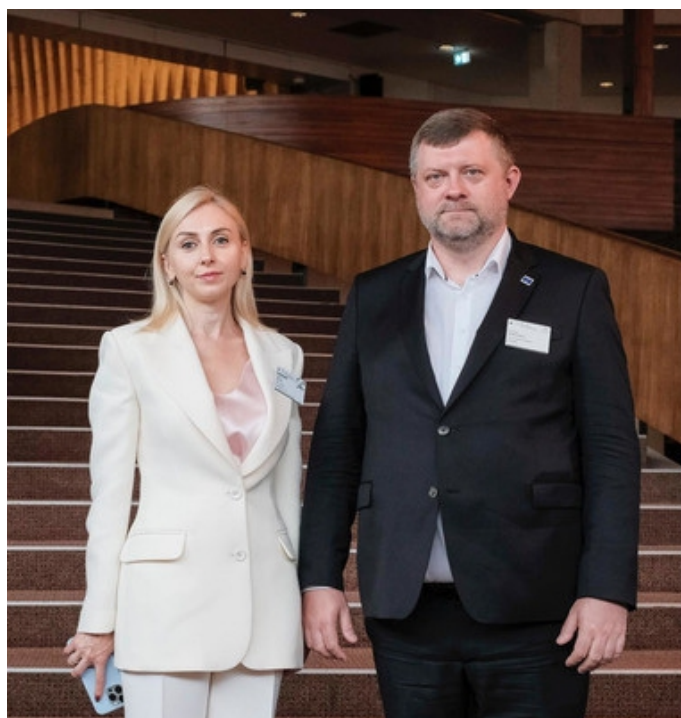
Зліва направо член Ради Комітету НААУ з питань виборчого права Тетяна Сав'як та Перший заступник Голови Верховної Ради України Олександр Корнієнко під час діалогу високого рівня «Добре демократичне врядування в Україні: досягнення, виклики та шлях вперед у повоєнний період»

Довідково: діалог високого рівня був започаткований у штаб-квартирі Ради Європи у листопаді 2022 року. Його метою є обговорення реформ демократичного врядування в Україні та досягнення широкої згоди щодо наступних дій з удосконалення законодавчої бази з огляду на європейські стандарти та статус України як країни-кандидата на вступ до ЄС.