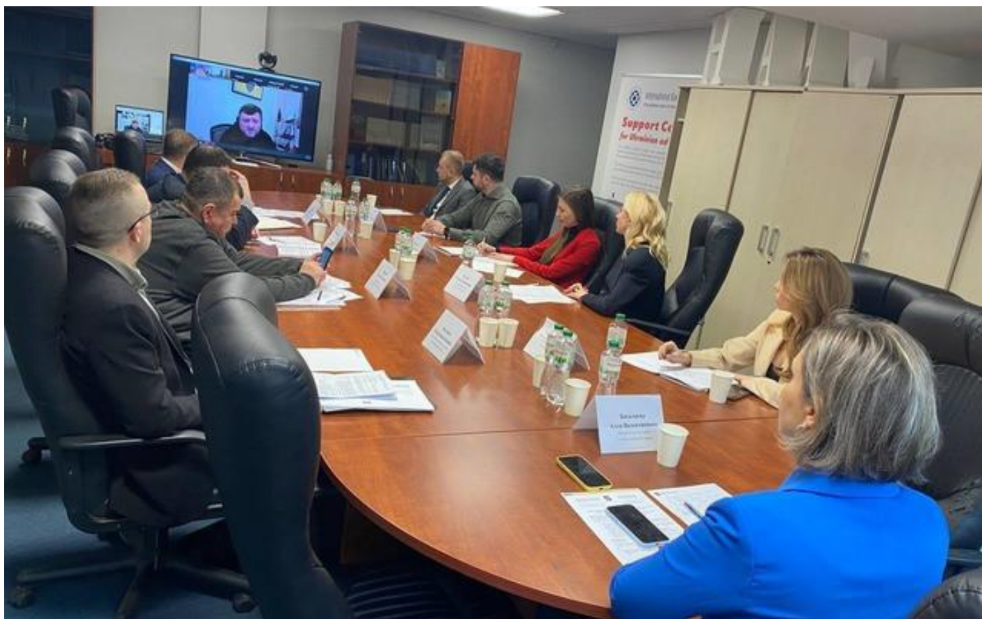
Виступ Першого заступника Голови Верховної Ради України Олександра Корнієнка (на моніторі) під час заходу 13 березня 2024 року

Участь у заході взяли політики, судді, представники Центральної виборчої комісії України та науковці.